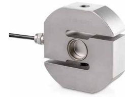
CS P2 0,5-7,5 t