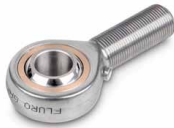
Fig. muestra accesorio opcional SAUTER CE R20, en la tienda de la web encontrará otros accesorios